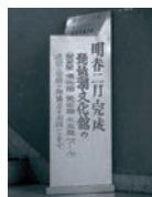
琵琶湖文化館建設募金箱