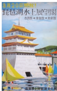
開館告知パンフレット